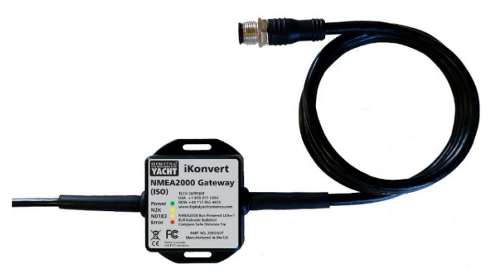
iKonvert Convertidor NMEA 2000 a USB – 155€ más IVA